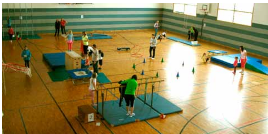
Einige aufgebaute Stationen in der Sporthalle