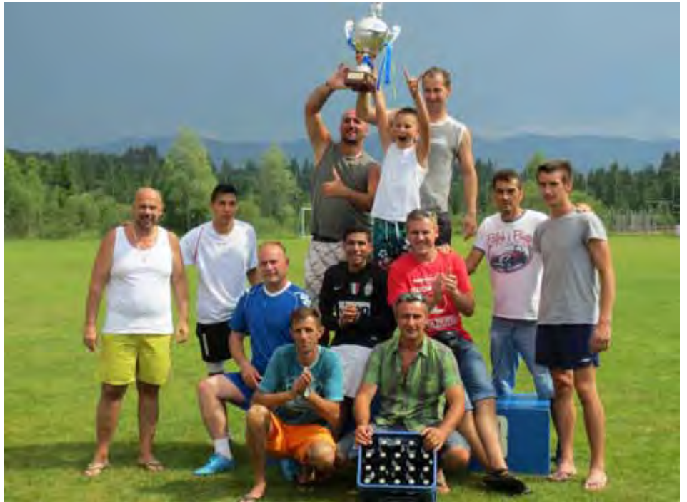
Die Siegermannschaft im Dorfturnier „Lechbrucker Hof“