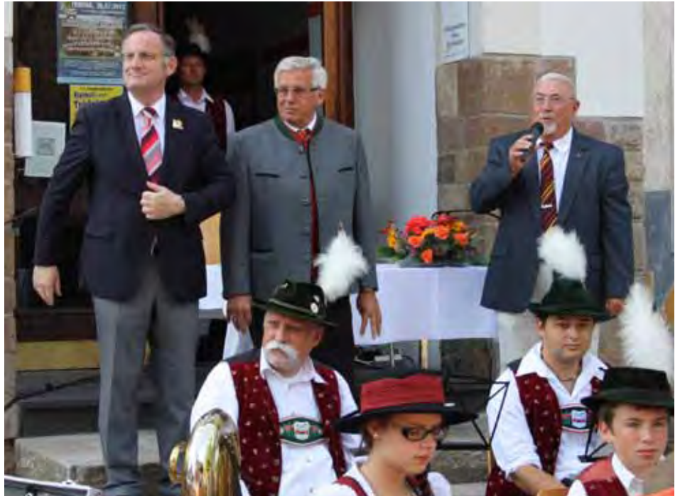
Empfang in Lendersdorf.