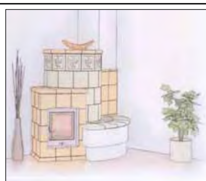
AKTIONSWOCHEN für Kamin- und Pelletöfen, Herde