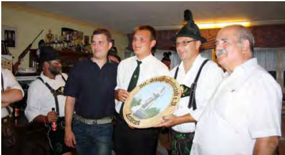
Gewinner der Festscheibe waren die Lendersdorfer Schützen.