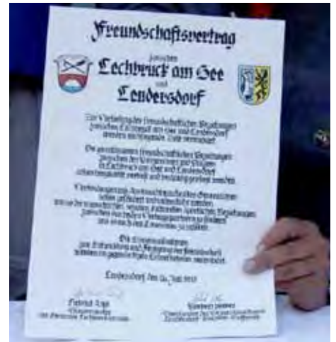
Freundschaftsvertrag Lechbruck am See und Lendersdorf